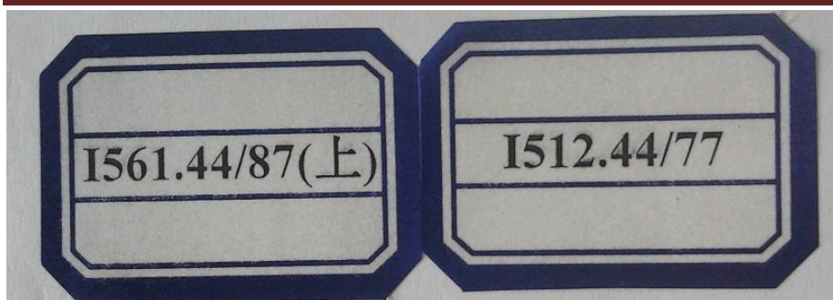
(图 1-1 书标规格以我方提供实物为准)