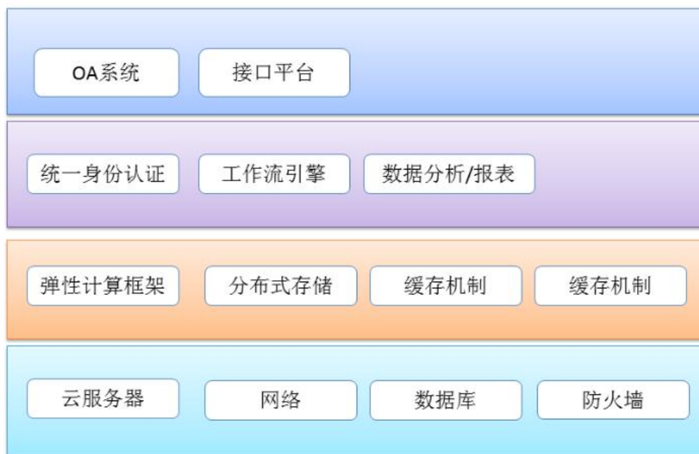
图 3.2 系统总体架构图

OA 系统业务主要面向机关部门及其内设机构、直属单位、办事处；展现方式包括网站、微信、移动端（APP）等方式；构建内部 OA 办公系统和信息公开网站以及移动办公系统；通过统一身份认证、 workflow 平台、数据分析/报表、数据交换平台等，为系统应用和业务协同提供技术支持；应用弹性计算、弹性 web 框架、海量数据挖掘为系统应用提供基础服务；通过云平台云存储等为系统运行管理提供基本条件和基础环境。技术架构如下图所示：